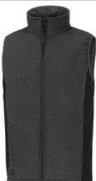
CHALECO SOFTSHELL POLIÉSTER 3 CAPAS LAMINADAS