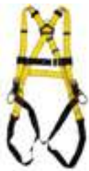
ARNÉS WORKMAN DE 3 ANILLOS

Previo al inicio de labores de protección contra caída y trabajo de altura, es necesario analizar donde se llevará a cabo las operaciones, para determinar la distancia de caída y puntos de anclaje del lugar donde se llevará a cabo las operaciones. Un factor indispensable es la adecuada inspección de todos los componentes de tus equipos.