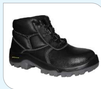
Botas de piel Crupón grabada - ASTM F 2413-11 MI/75 PR EH