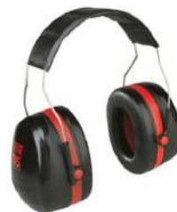
OREJERAS PELTOR OPTIME CON BANDA 30 dB H10A 3M