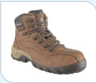
Botín Nitrogen CT CAT