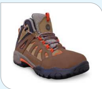
Botín Edelbrock ED-140