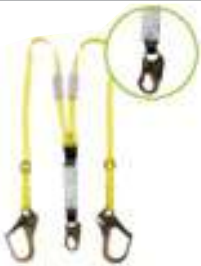
LÍNEA DE VIDA DOBLE C/ ABSORBEDOR DE IMPACTO