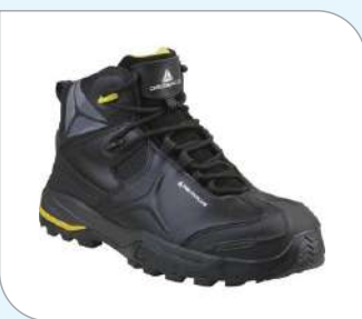
Botas de piel Flor S3 HRO HI CI SRC