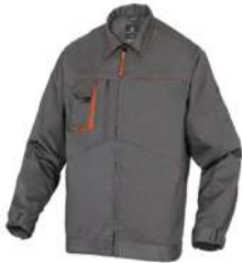
CHAQUETA DE TRABAJO MACH2 DE POLIÉSTER / ALGODÓN