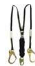
LÍNEA DE VIDA DOBLE THERMATEK C/ ABSORBEDOR DE IMPACTO