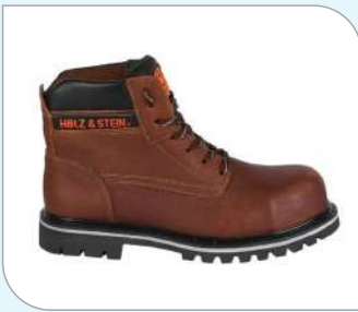
S17-1 Modelo BOCK FIBRA S PU CALZADO DIELECTRICO 18 KV