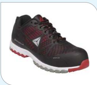
Zapato delta sport S1P SRC Delta plus