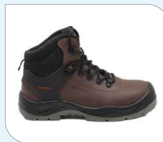
Botín Dieléctrico Volta 18KV