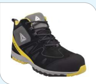
Calzado de Piel Seraje Afelpado - S3HRO SRC