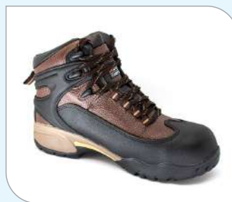
Botín Edelbrock ED 170 Mining