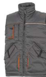
CHALECO MULTIBOLSILLOS MACH DE POLIÉSTER / ALGODÓN