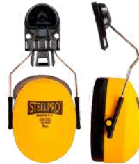
OREJERA PARA CASCO CM 3000