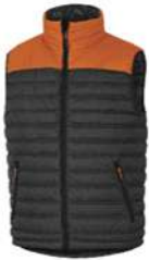
CHALECO PLUMÓN POLIAMIDA RIPSTOP IMPREGNADO PU