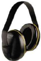
OREJERA SAMURAI 23 db

Un trabajador de los rubros de construcción, minería, aviación, entre otros están expuestos a ruidos mayores a 85db. La mejor manera de proteger sus oídos es utilizando tapones u orejeras con certificación ANSI S3.19. La contaminación acústica tiene efectos perjudiciales, no solo en el oído, sino también en otras partes del cuerpo.