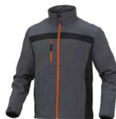
CHAQUETA DE SOFTSHELL POLIÉSTER / ELASTANO