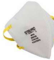
RESPIRADOR M 9910 BLANCO