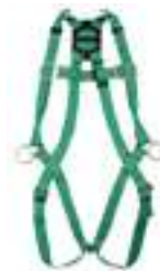
ARNÉS WORKMAN DE 3 ANILLOS