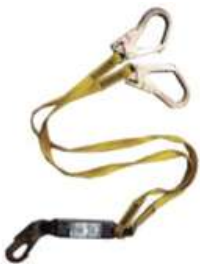
LÍNEA DE VIDA DOBLE (AMR2S-P5B) - STEELPRO

•Certificado y cumplimiento de la Norma ANSI 359.12-2013 y 2014