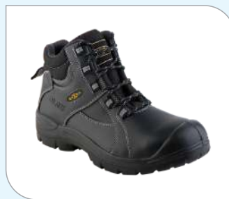
Botín Palio Negro NU 400 NAZCA