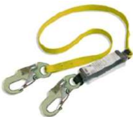
LÍNEA DE VIDA SIMPLE

•Línea de restricción o posicionamiento regulable (CAVRL - P55) - gancho 3/4 Steelpro