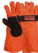
GUANTE DE CUERO SOLDADOR NARANJO - NEGRO