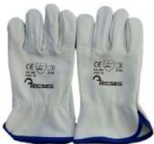
GUANTES DE CUERO BADANA AS010

Los guantes proporcionan una de las principales de defensa contra cortes y abrasiones y no olvidar la protección química y térmica al hacer su selección.