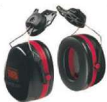
PELTOR H10P3E adaptables a casco