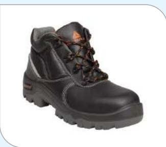
Botas de piel Crupón grabada - S3 SRC

En la medida de lo posible el calzado de seguridad debe ser transpirable, para que el aire circule. La incomodidad, mala adaptación o poca transpiración hará que nos cueste más utilizar este tipo de calzado, por ello es importante brindarle al personal zapatos ergonómicos y cómodos.