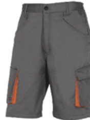
BERMUDA DE TRABAJO MACH2 DE POLIÉSTER / ALGODÓN