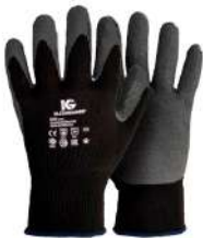
G40 CON PALMA DE LÁTEX T/9