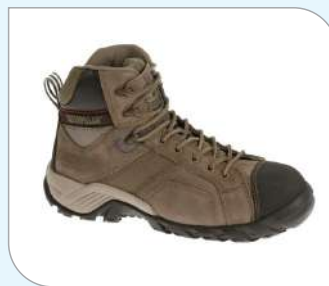
Botín Argon hi Caterpillar