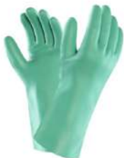
GUANTES DE NITRIL - SOLVEX