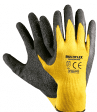
MULTIFLEX LÁTEX ORIGINAL