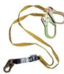
LÍNEA DE VIDA DOBLE (AMR2S-VRZ) N.2009 - STEELPRO

•Certificado y cumplimiento de la Norma ANSI 359.12-2013 y 2014