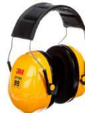
PELTOR H9P3E adaptables a casco