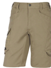
BERMUDA DE TRABAJO MACH SPIRIT DE 60% DE POLIÉSTER / 40% DE ALGODÓN