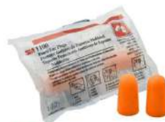
OREJERA SERIE 1100 / 1110