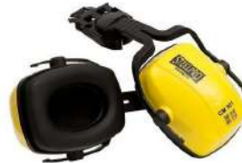
OREJERA PARA CASCO CM 501