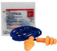
OREJERA SERIE 1270 / 1271