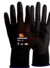
GUANTES G40 POLIURETANO