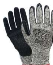
MULTIFLEX CUT - 5 PU