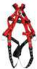
ARNÉS DE 4 ANILLOS TECHNACURV PULLOVER