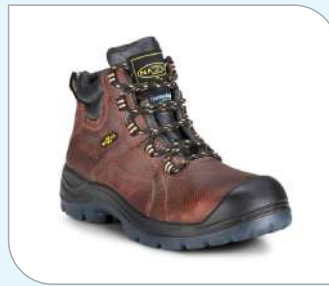
Botín Tucson NT 450