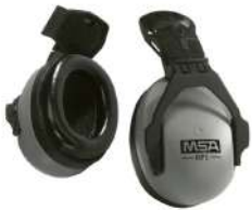
PROTECTOR HPE adaptables a casco