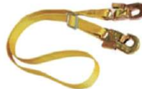
LÍNEA DE RESTRICCIÓN O POSICIONAMIENTO REGULABLE

•Certificado y cumplimiento de la Norma ANSI 359.12-2013 y 2014