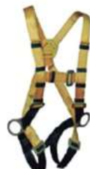
ARNÉS 3 ARGOLLAS STANDARD (APA3A-AA0) - STEELPRO