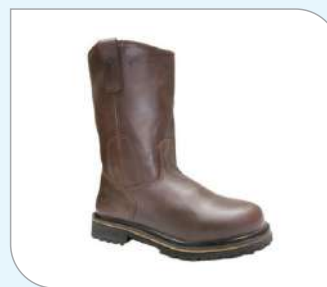
Botas de piel Crupón grabada - S3 SRC