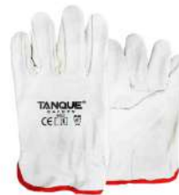
GUANTE DE BADANA - TANQUE