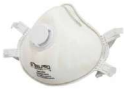
RESPIRADOR M 933 V C/VÁVULA