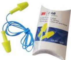
3M™ E-A-R™ ULTRAFIT™