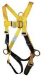
ARNÉS 4 ARGOLLAS STANDARD (APA4A - Ad0) - STEELPRO

•Certificado y cumplimiento de la Norma ANSI 359.12-2013 y 2014